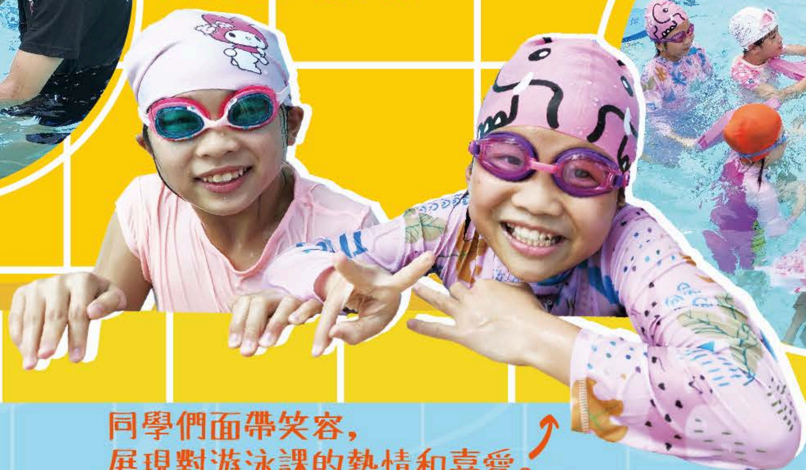
同學們面帶笑容，展現對游泳課的熱情和喜愛。