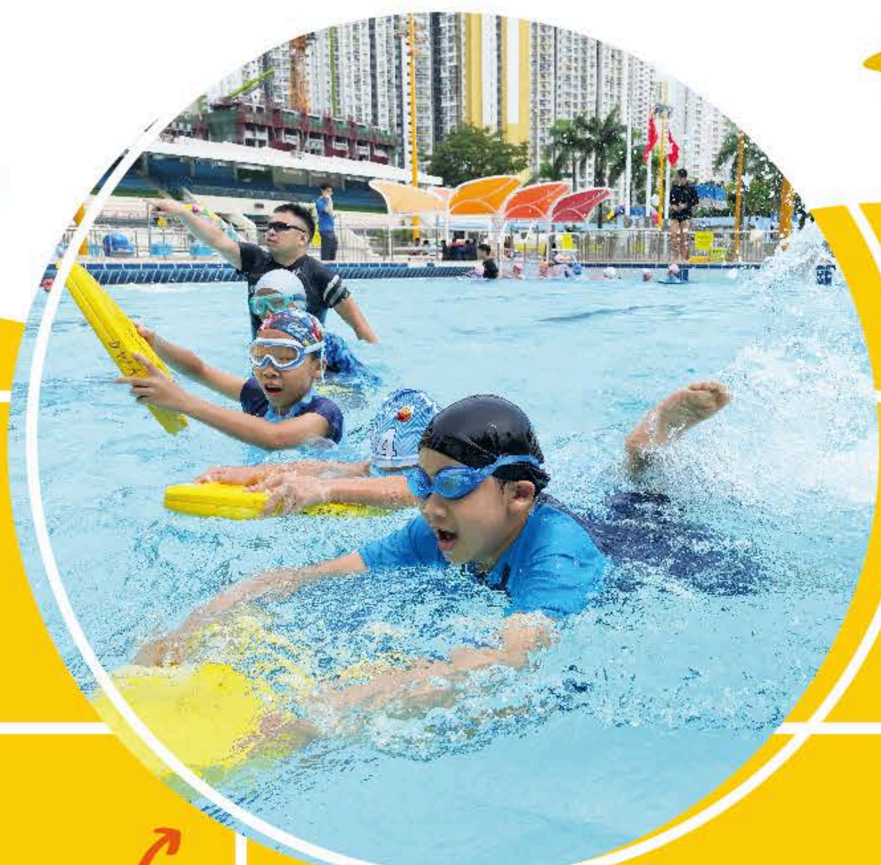
同學們在泳池中暢泳，享受游泳帶來的樂趣和挑戰。

九月，四年級同學迎來了一次令人振奮的水中冒險！本校精心安排了為期六節的游泳課程，旨在讓每位同學在專業教練的悉心指導下，根據自身能力逐步 掌握游泳的基本技巧 。這不僅是一次技能的提升，更是自信的建立和挑戰自我的過程。透過游泳課程，同學們能 在水中暢泳，享受游泳的樂趣 。明年五月，我們也將為三年級的同學開設游泳課程，讓我們一起期待下一次的成長之旅吧！