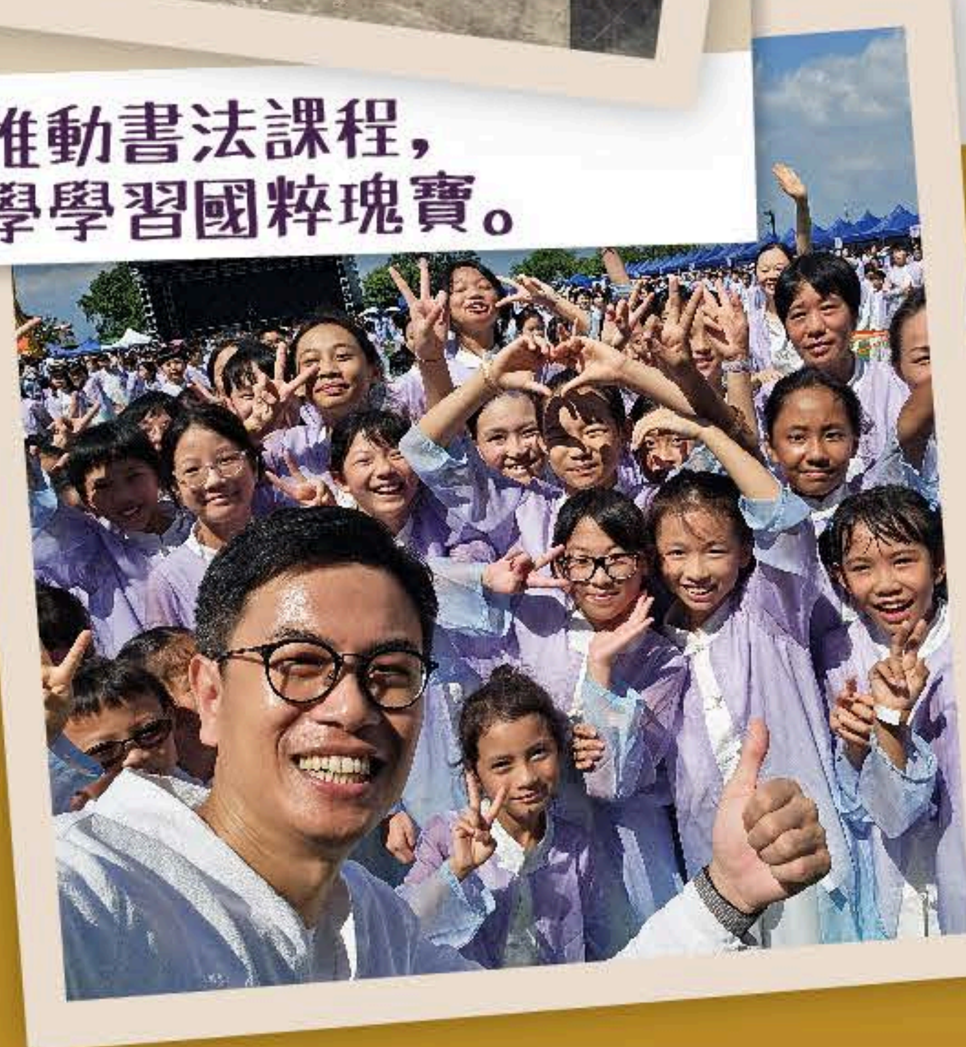
我們團結一心，以歌舞刷新世界紀錄，對外展現中華文化魅力。