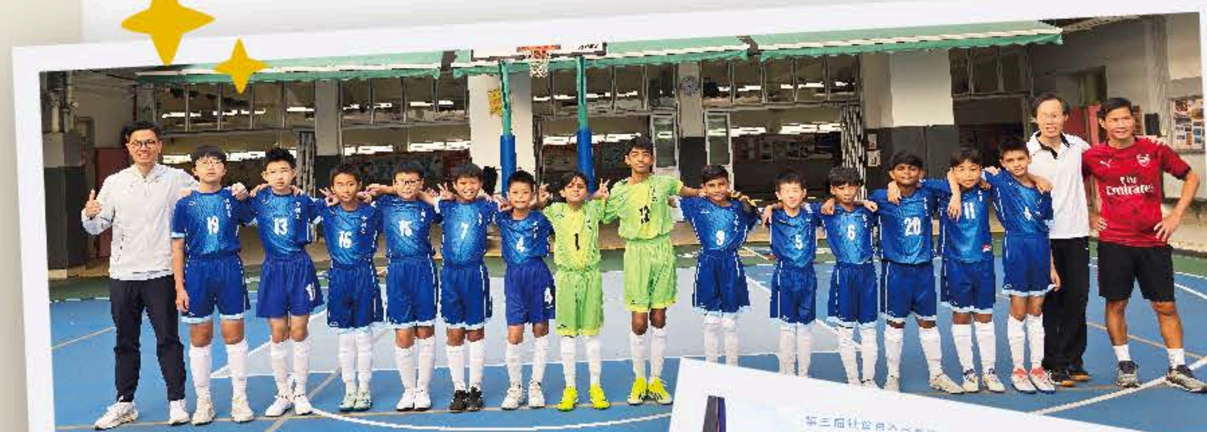
足球校隊 氣勢十足