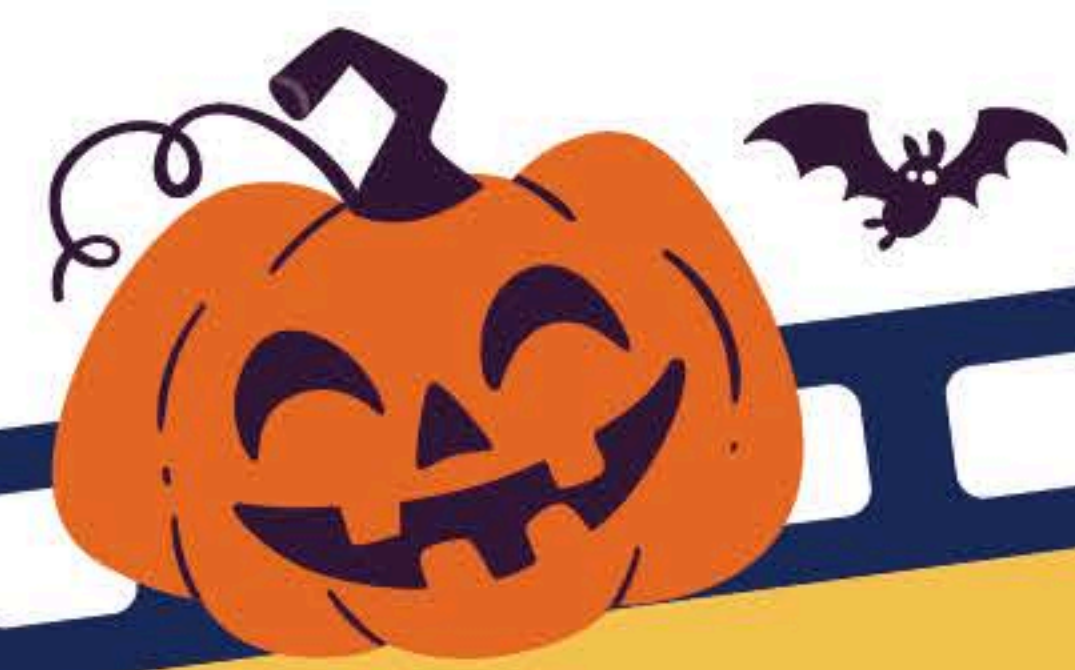
EAs run booth games on Halloween Day in the school hall.