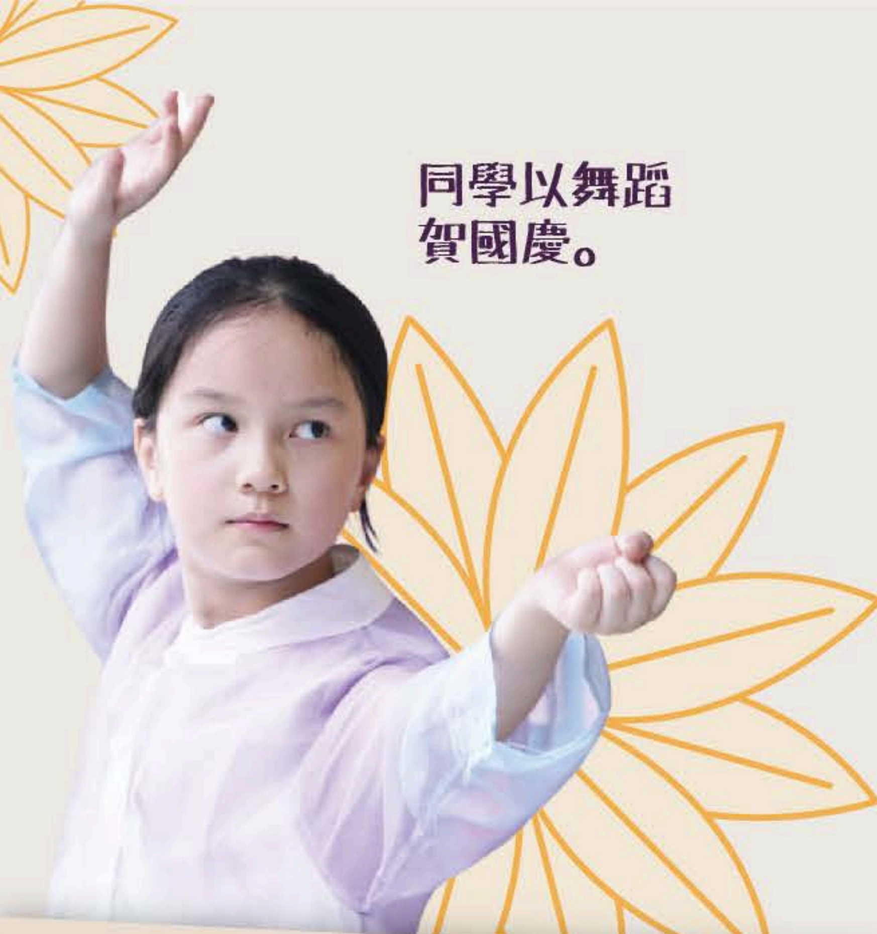
同學以舞蹈賀國慶。

國慶前夕，我校師生和家長參加了「 愛我中華·千年傳承共舞動 」大型文藝活動。透過 歌舞 表演，宣揚中華文化，活動同時刷新了 健力士世界紀錄 。中華文化博大精深，我們的同學會繼續秉承優良的傳統文化，弘揚家國情懷。