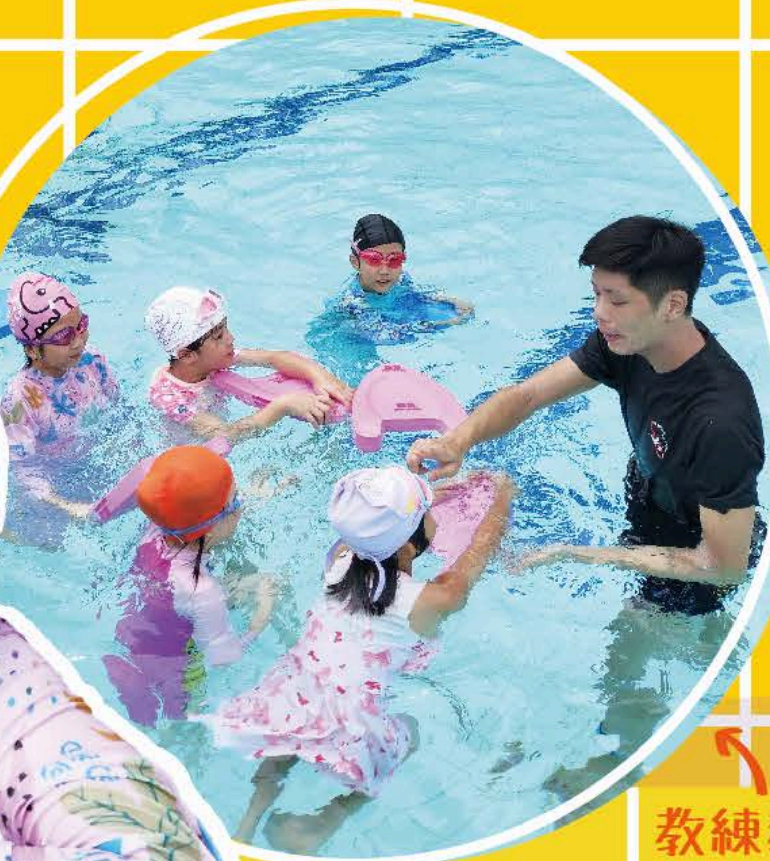
教練教授同學們基本的游泳姿勢。