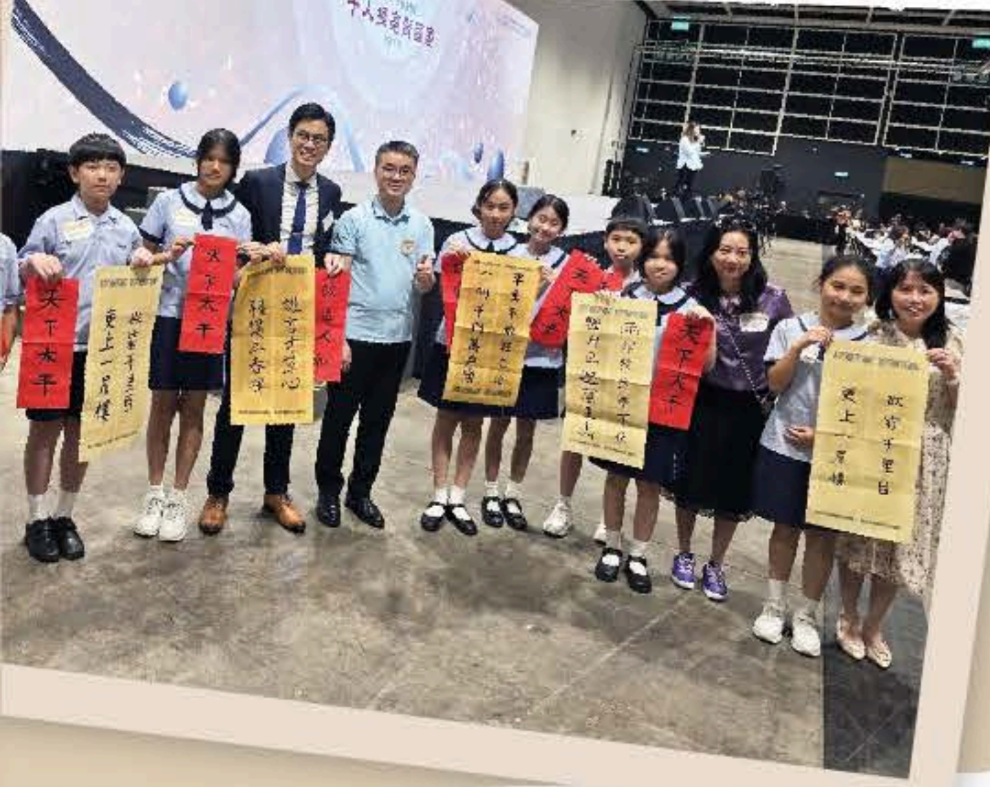
本校推動書法課程，讓同學學習國粹瑰寶。