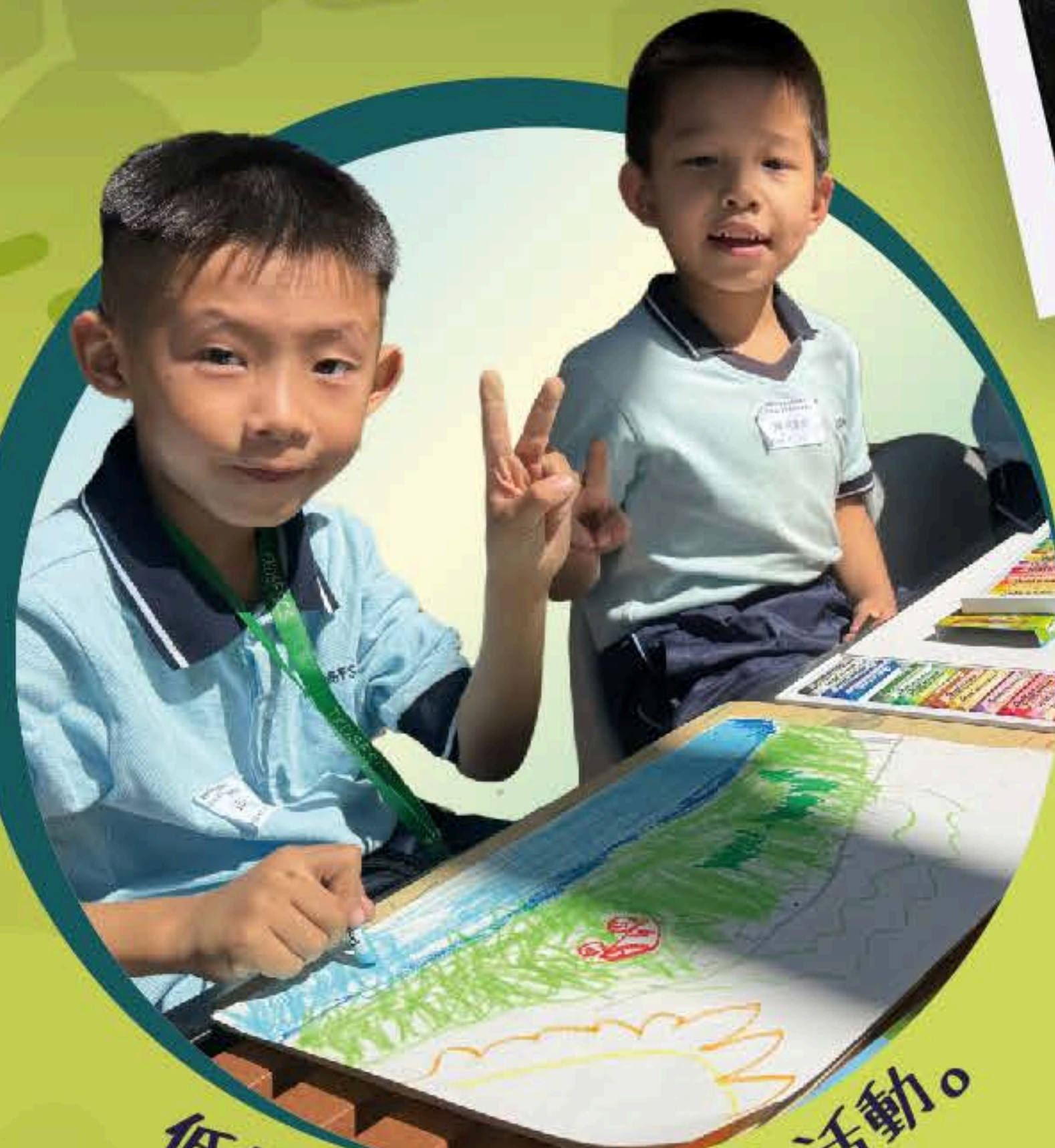
低年級同學進行寫生活動。

在11月8日這個陽光明媚的日子，我們在屯門蝴蝶灣公園迎來了一年一度的戶外學習日。這個萬眾期待的學習活動不僅讓同學們有課堂外的學習機會，還能讓他們親近大自然，感受一草一木的美好。