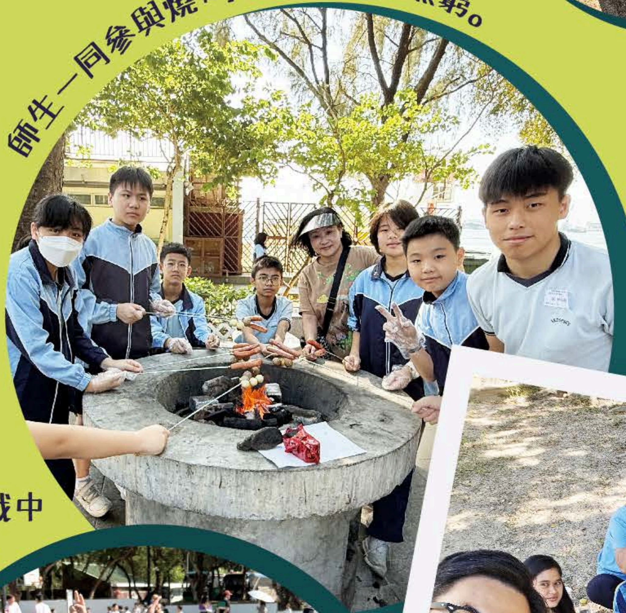
師生一同參與燒烤活動，其樂無窮。

低年級的同學有機會參與 集體遊戲 ，這些遊戲不僅增強了同學之間的默契，也讓他們學會了如何在團隊中發揮所長，互相支持與鼓勵。在這輕鬆愉快的氛圍中，同學們笑聲不斷，感受到無窮的樂趣。高年級的同學則有機會進行 燒烤活動 ，從策劃活動、預備物資，到炮製食物，同學在過程中獲益良多，既提升了責任感，還學會了分享與合作，實屬一次難能可貴的機會。