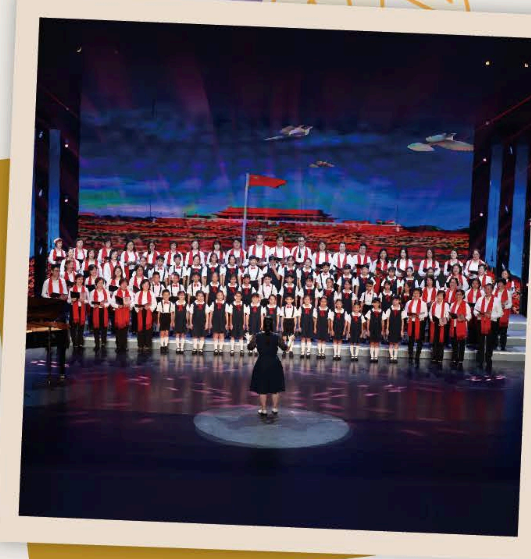
王校監、曾校長和同學唱響大灣區，同築中國夢。