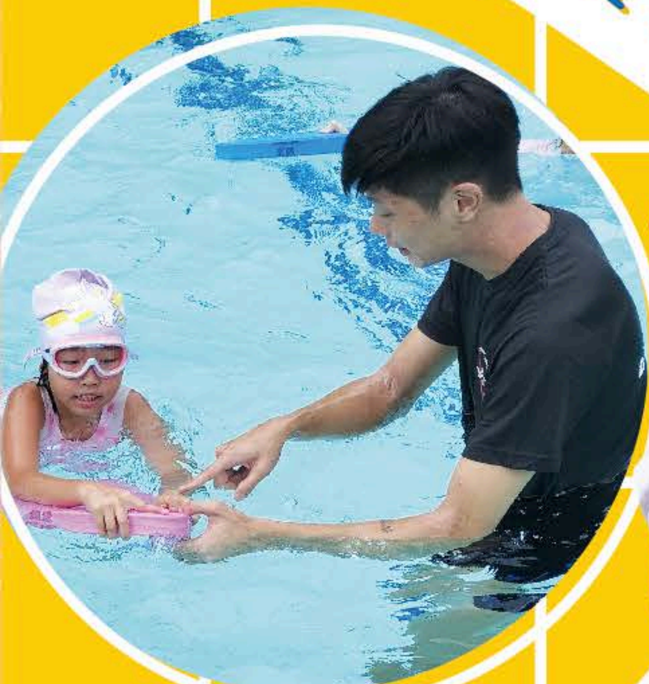
教練細心地指導同學游泳的技巧。