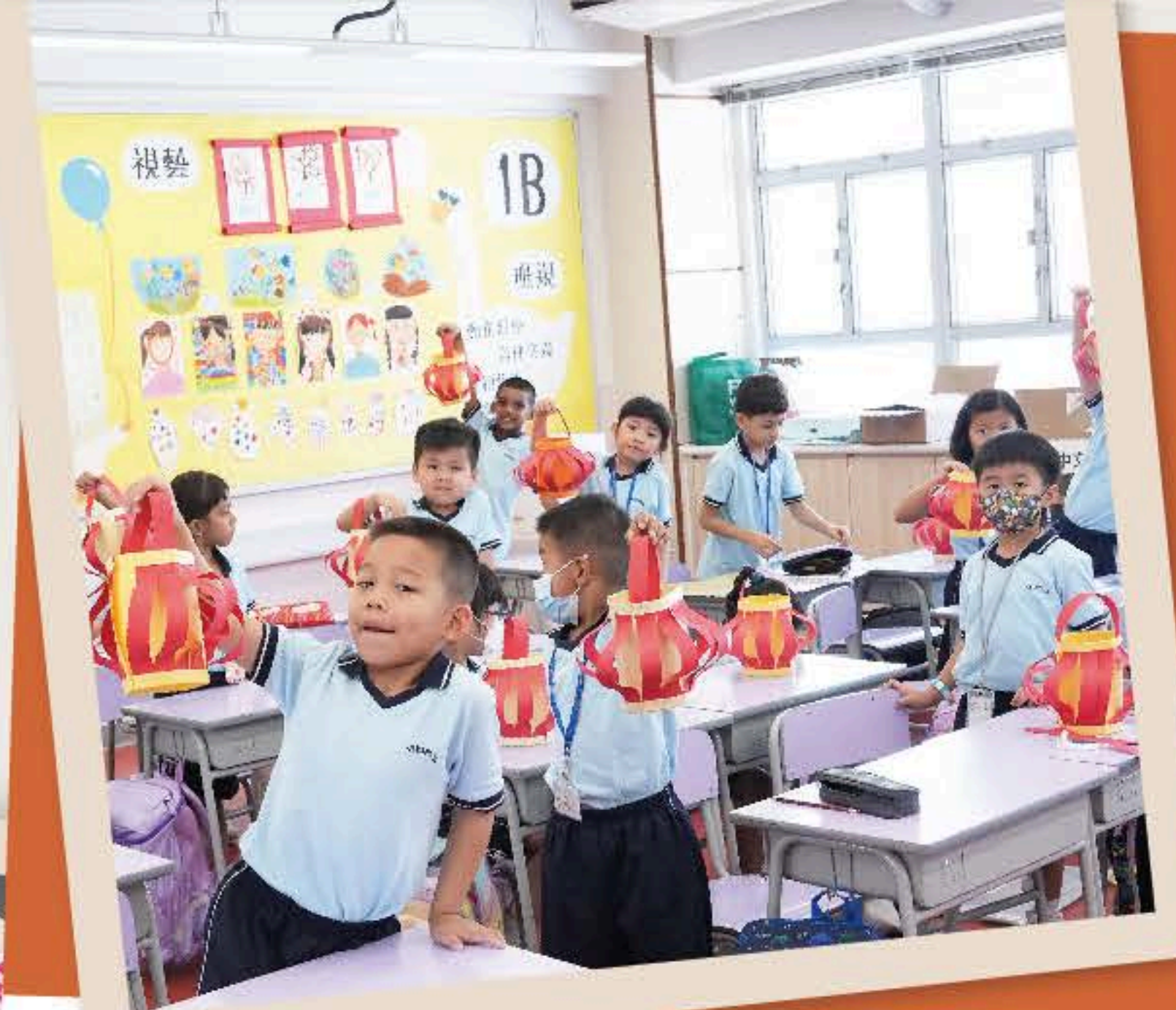
小一同學製作燈籠為節慶添氣氛。