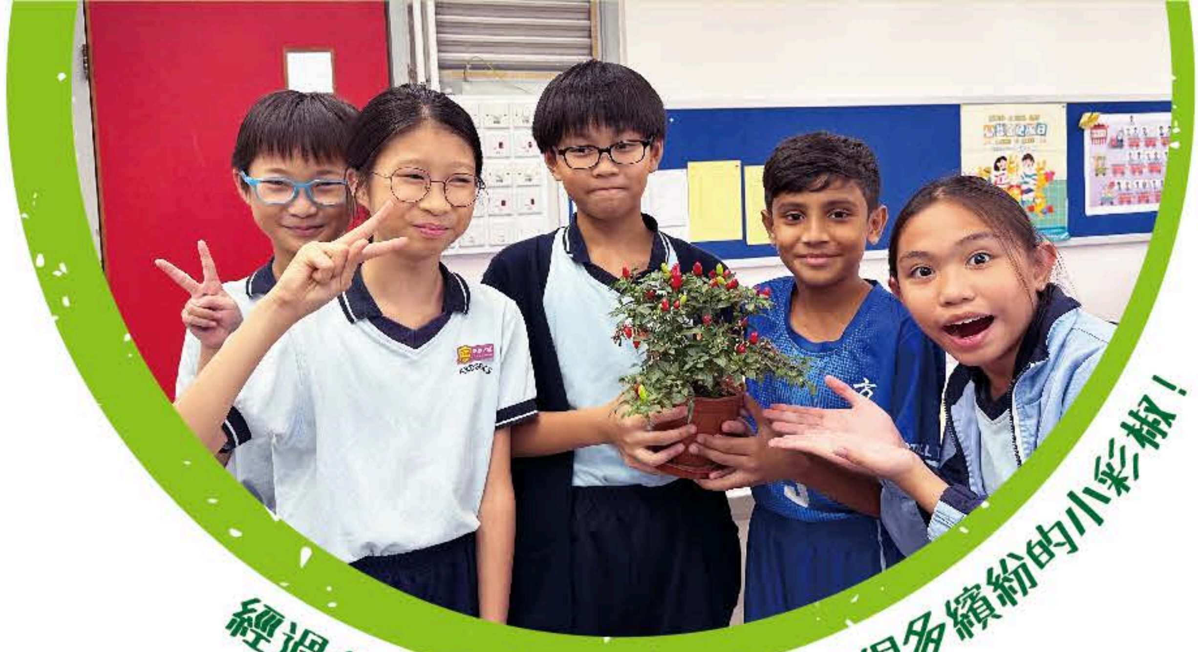
經過我們的努力，終於長出了很多繽紛的小彩椒！