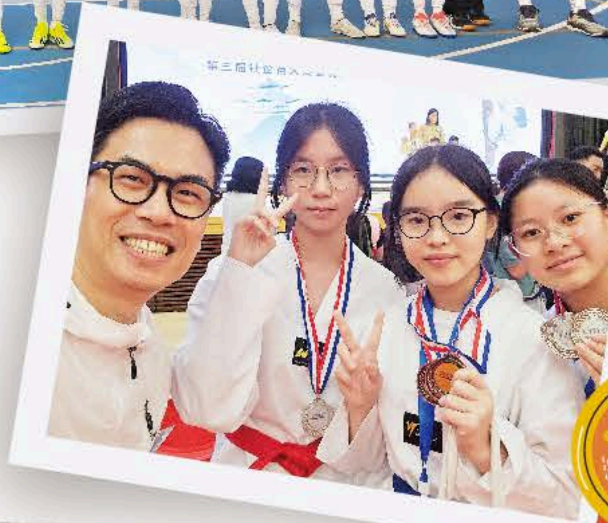
本校跆拳道 學員在大賽 中獲獎。