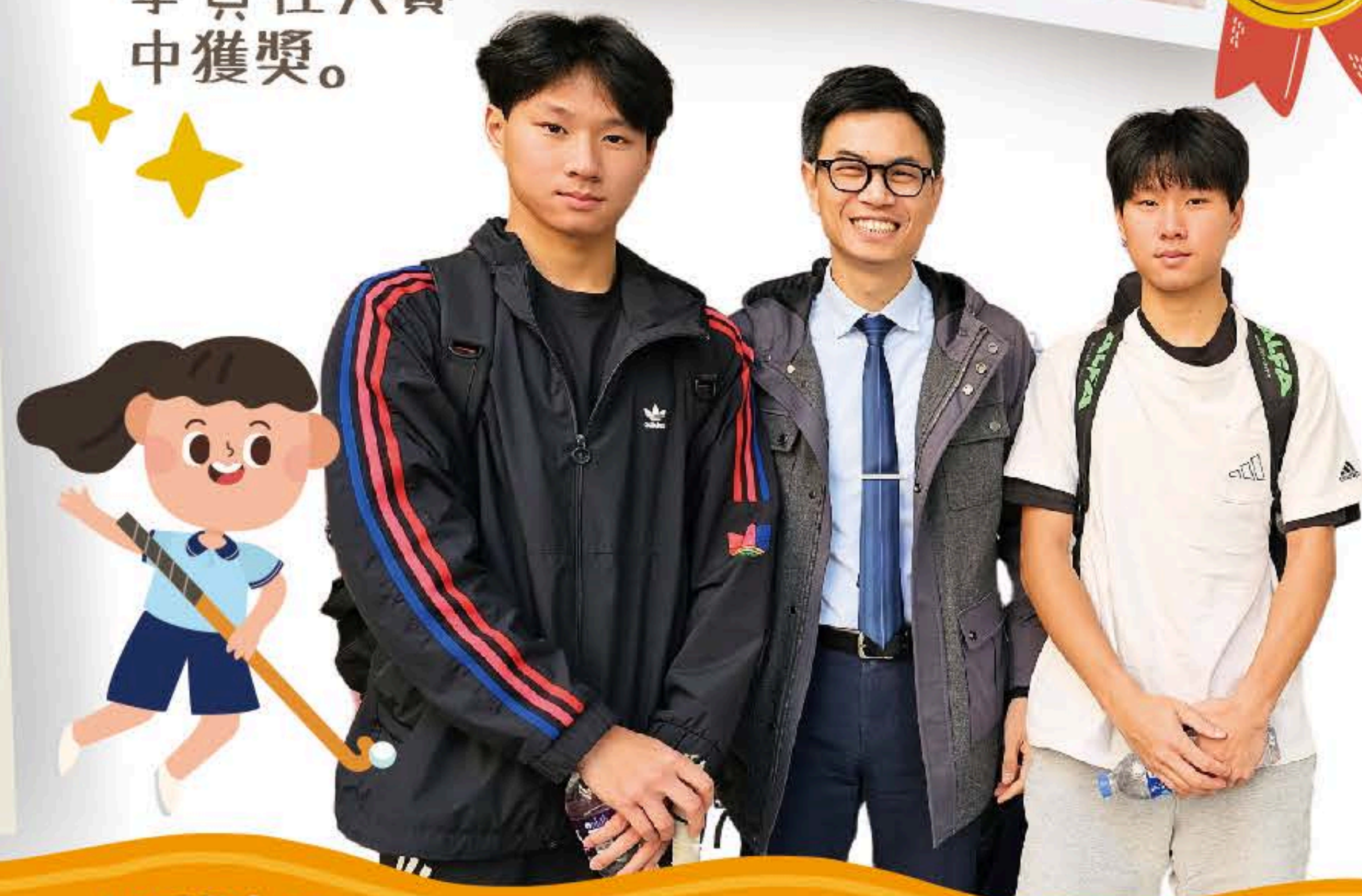
曲棍球隊校友不時回到母校，與學弟學妹切磋球技，薪火相傳。