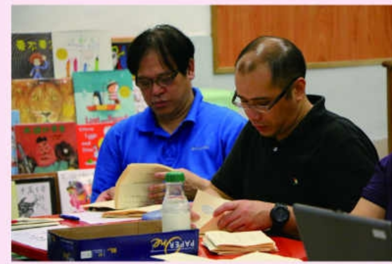
教師執委正忙於點票