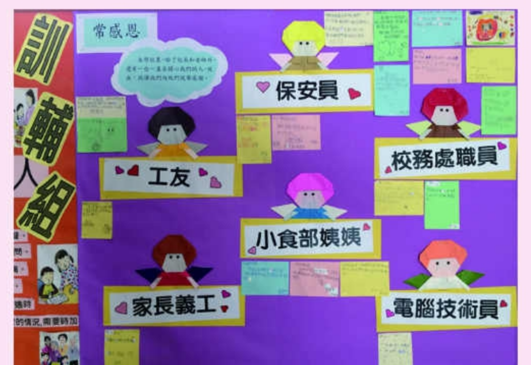
配合壁報活動，展示學生對各學校職員的感謝和祝福。