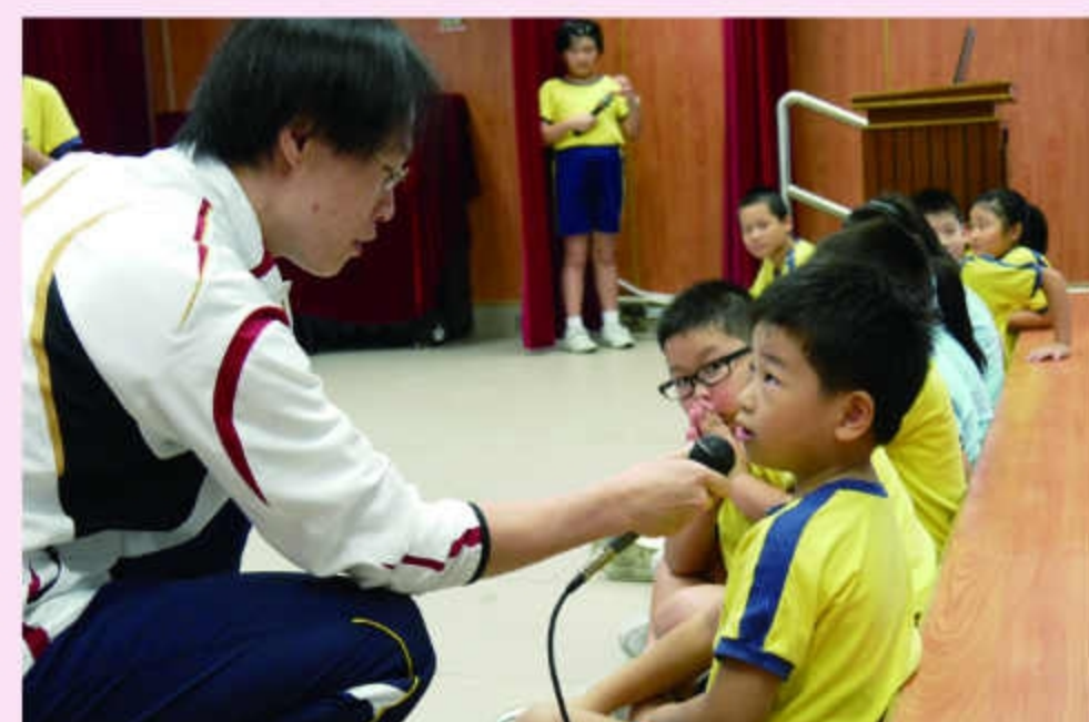
鼓勵學生踴躍發表意見，激發學生思考。