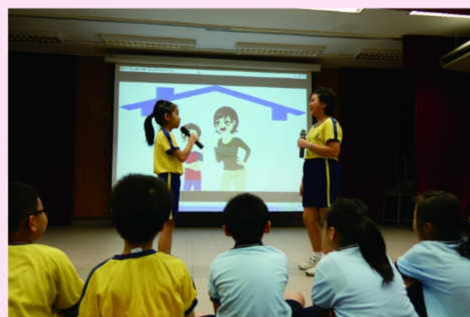
學生參與故事短劇表演，帶出關愛和尊重的訊息。