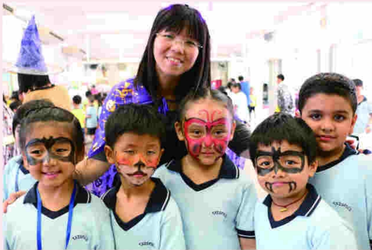
Halloween Party time is great and fun.

Look forward to other meaningful English learning activities in the future.