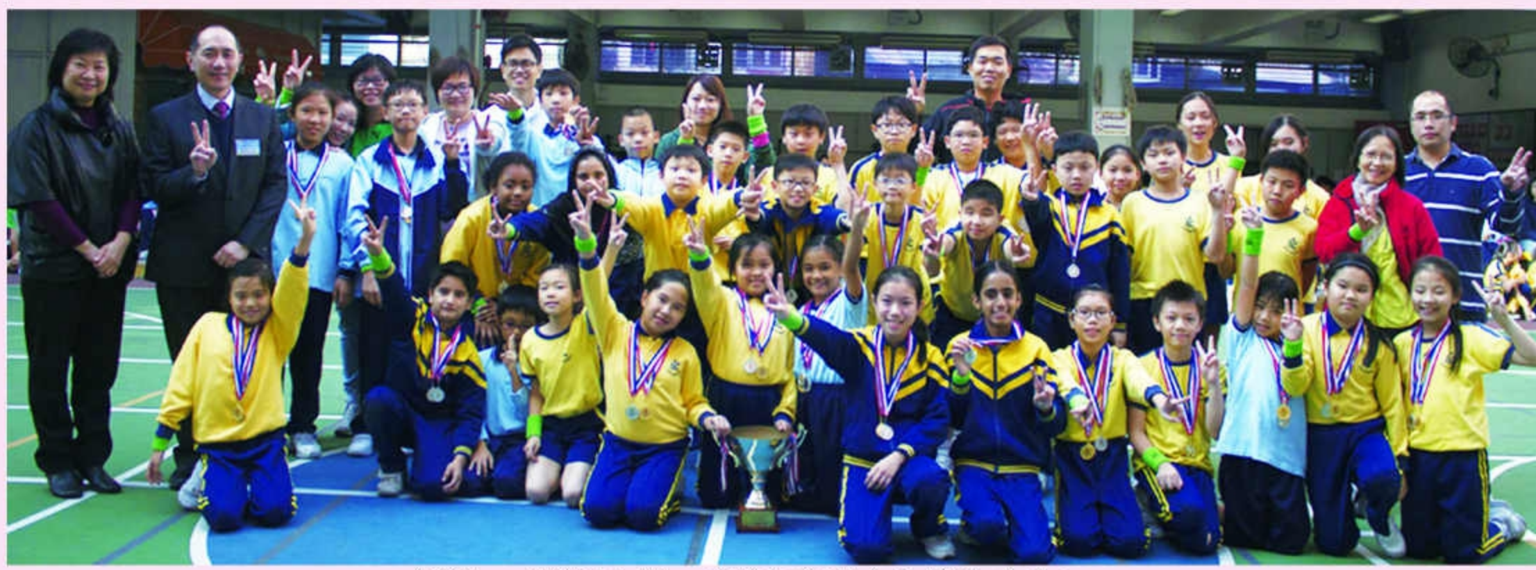
經過一天的比賽，誠社勇奪全場總冠軍！