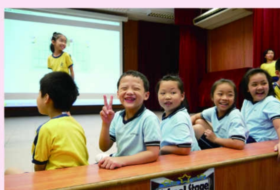
德育小故事以互動形式進行，鼓勵學生台上分享，學生投入參與。