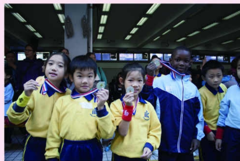
同學們都滿載而歸！