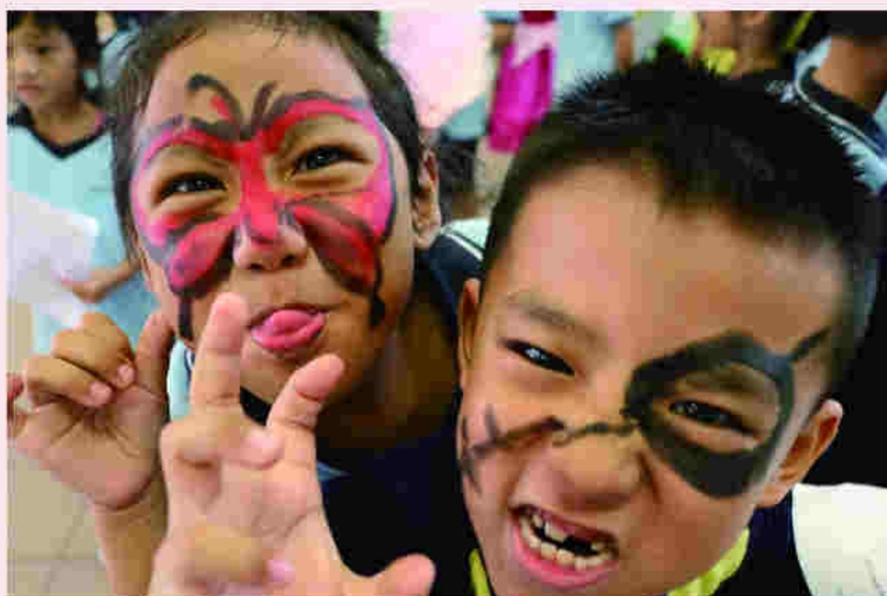
How scary they are - Face painting is fun.