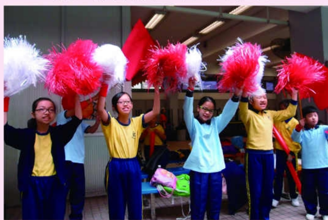
勤社的打氣隊伍聲勢最浩大！