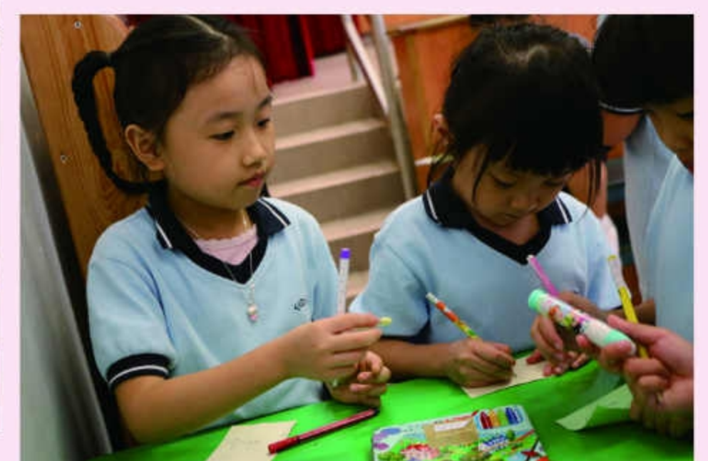
學生寫上心意，向感謝的人送上祝福。