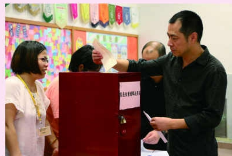
家長親身到校投票