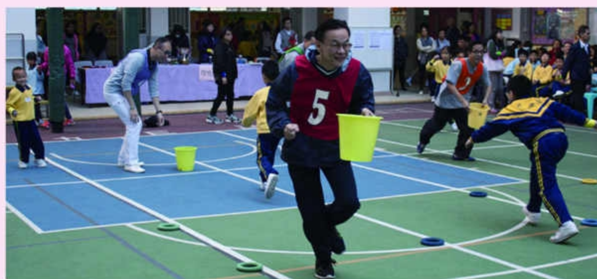
親子比賽：家長比我們的同學還要落力呢！