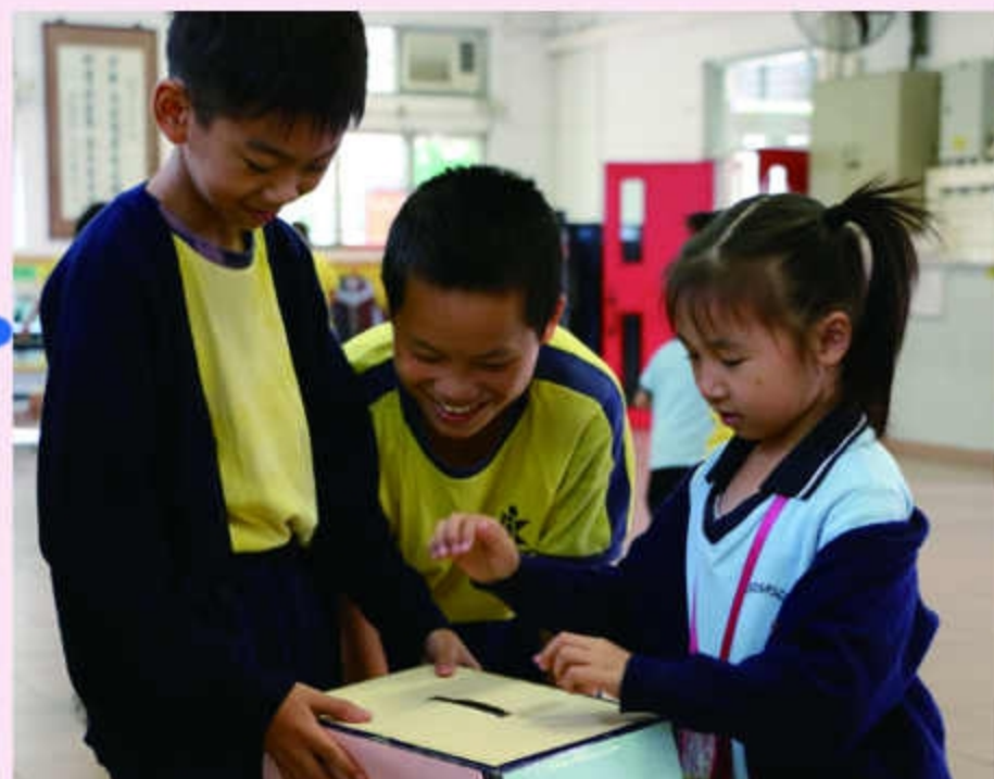
安排德育大使，鼓勵學生將心意紙投入收集箱。