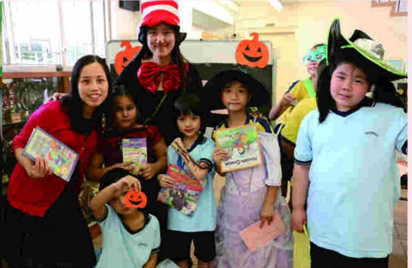
Halloween Reading Corner is attractive too.