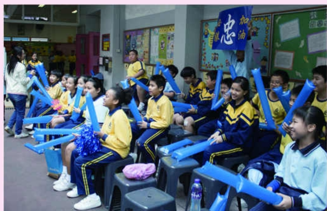
忠社的打氣隊伍一點也不遜色！