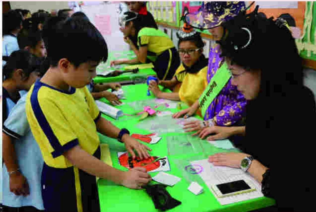
Halloween puzzle is quite challenging.