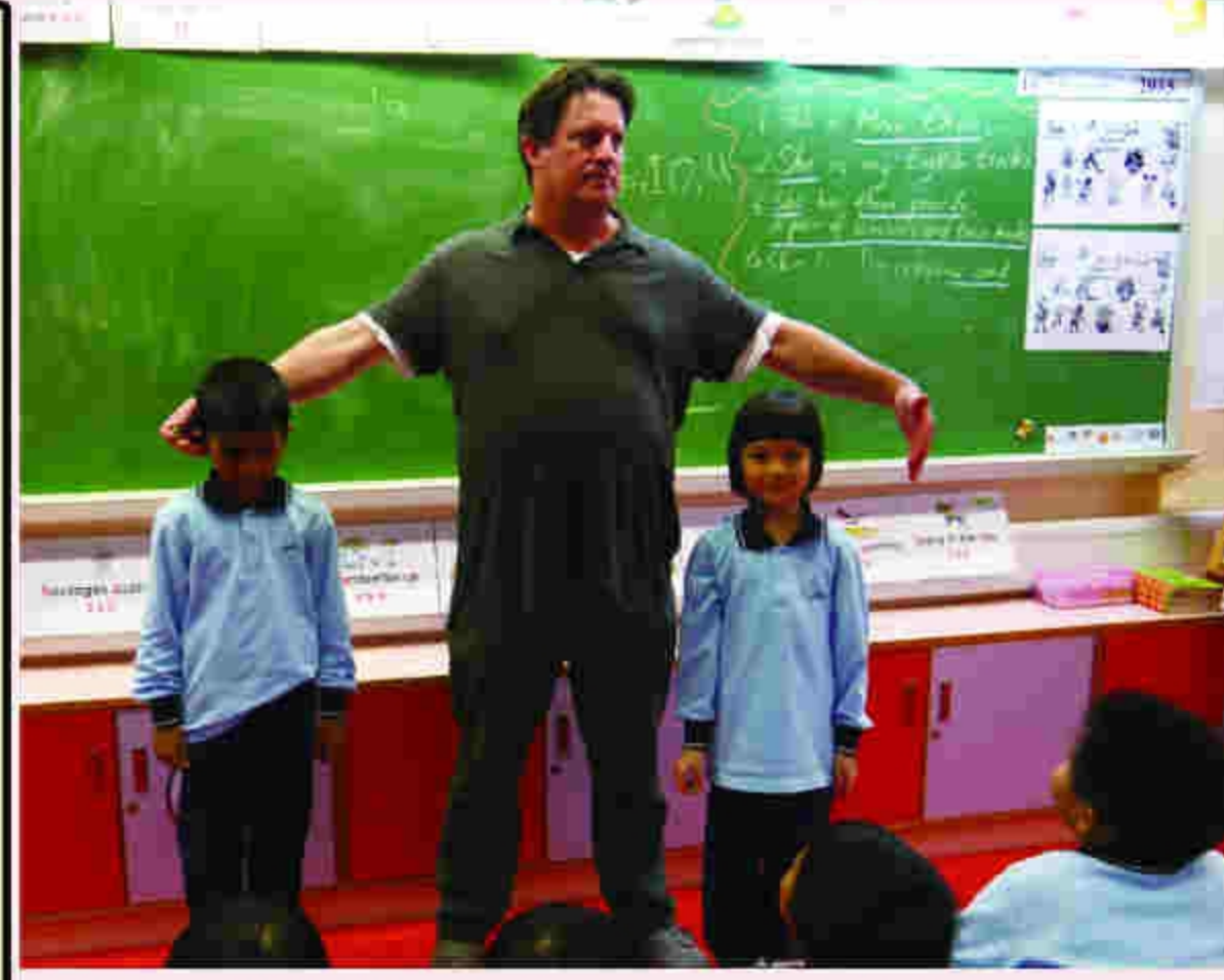
Girls and boys are having phonics mini test at the moment.