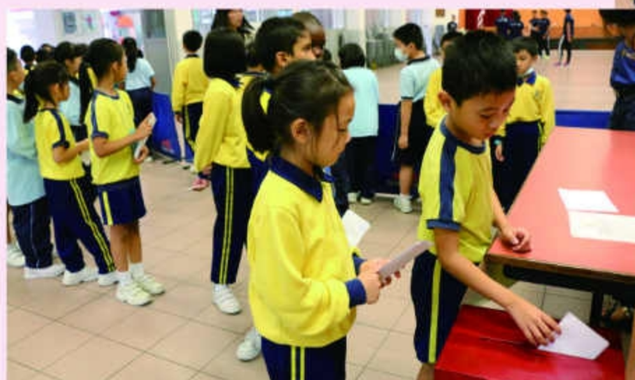
學生體驗投票的過程