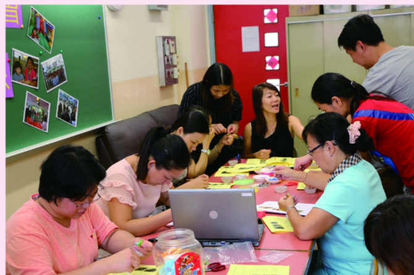
正能量義工隊成員正埋頭苦幹，研究七彩魚的製作。