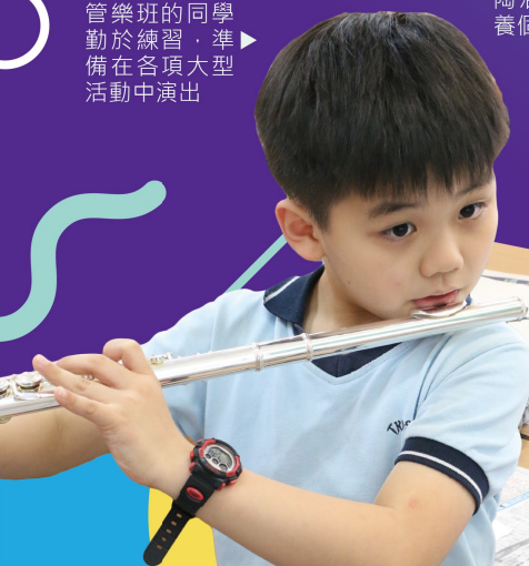
管樂班的同學勤於練習，準備在大型活動中演出