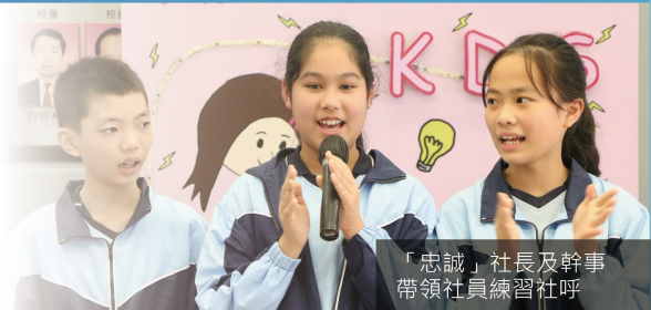
「忠誠」社長及幹事帶領社員練習社呼

本年度的學社幹事增加至六名，每個年級由一名幹事擔任聯絡人，負責傳達學社訊息。在9月的學社大會上，候選人都積極為自己拉票，希望當選成為社長或幹事，為學社多出一分力。而社員則在社監的帶領下投入地練習打氣，聲勢浩大。一時間，打氣聲響徹整個校園。相信今年必有一番龍爭虎鬥，各社也不會再讓「勤社」獨佔學社總冠軍的寶座了。