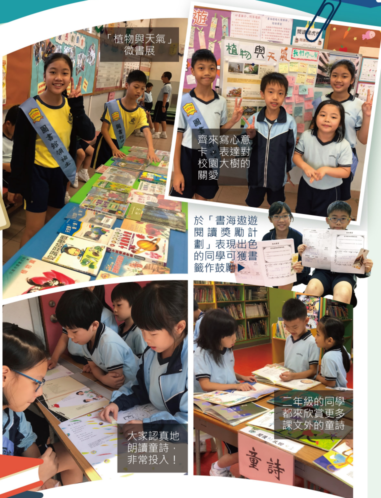
「植物與天氣」微書展