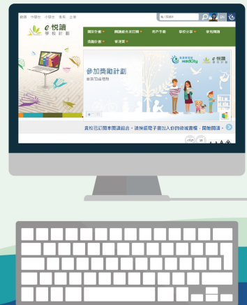
參加「e-悅讀計劃」，隨時享受閱讀的樂趣

為配合各科課程，延伸課堂知識，圖書科會舉辦不同主題的微書展和活動，如「植物與天氣」和「童詩欣賞」。本年度，學校更參加了香港教育城的「e-悅讀計劃」，老師會在圖書課上教導同學使用該電子平台，讓大家能夠無時無刻地享受閱讀的樂趣。