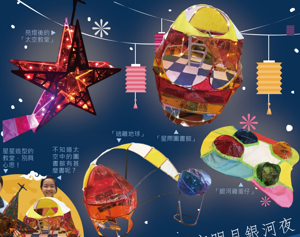
亮燈後的「太空教堂」