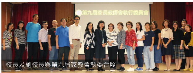
校長及副校長與第九屆家教會執委合照