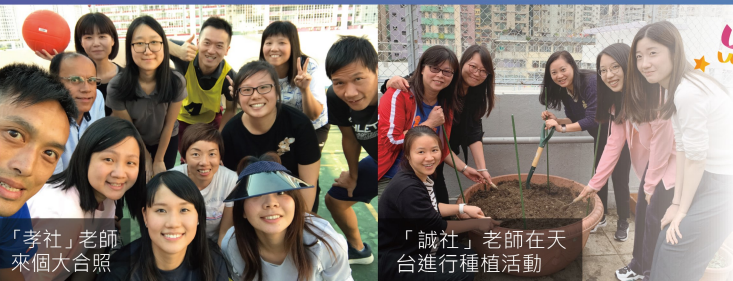
「孝社」老師來個大合照