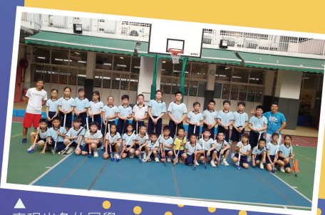
表現出色的同學可獲推薦加入曲棍球校隊，參加全港及境外交流比賽

學校積極鼓勵同學發展體藝才能，在專業教練的指導下，同學的技能均有顯著的提升。而參與群體活動，亦培養了同學團隊合作的精神。部分表現出色的參加者更有機會獲推薦加入校隊，使學校生活變得更加難忘，更具挑戰性。