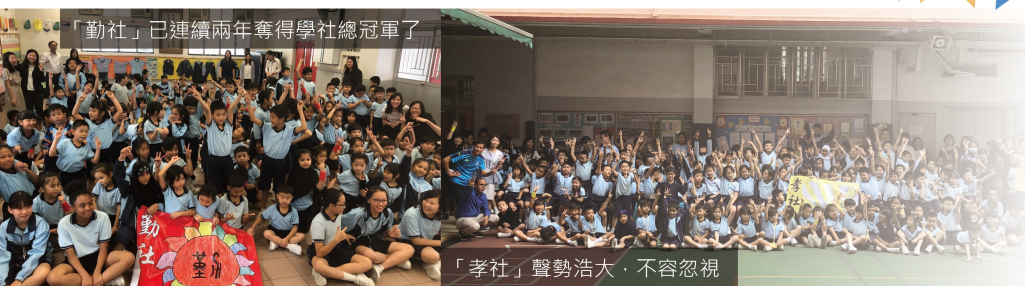
「勤社」已連續兩年奪得學社總冠軍了